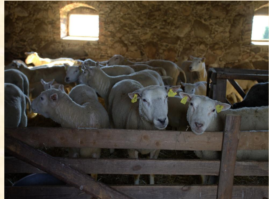
Eesti tumedapealised ja eesti valgepealised lambad