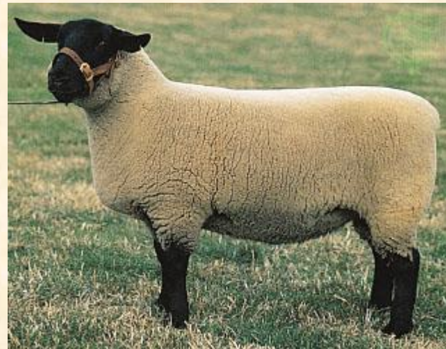
Suffolki tõugu lihalammast