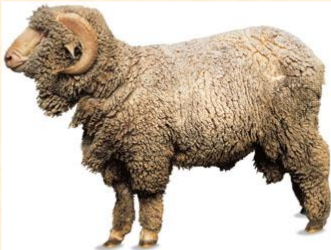
Meriino tõugu villalammast

Mõisates peeti välismaiseid peene villaga tõulambaid , hiljem lihalambaid ja lõpuks liha-villalambaid, kellelt saadi nii head villa kui ka liha. Mõisa lambaid ristati kohalike talupojalammastega, mistõttu paranesid maalamba villa- ja lihatoodang. Samas jäi maalammastest ikka maalambaks.