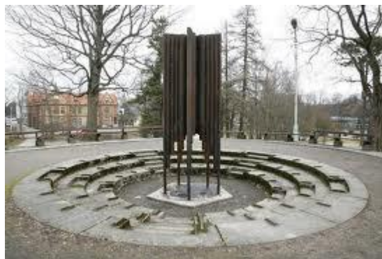
Pärnu Munamäe tipus kõrguv lõkkeplats