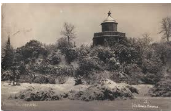
Pärnu Munamägi 1930

Bastion- kindluse kaitseehitis. Seoses tulirelvade arenguga kaotasid senised sõjalised kaitserajatised tähtsuse ning 1836. aastal kustutati Pärnu ja mitmed teised linnad Vene impeeriumi kindluste nimekirjast. 1860. aastail hakati endiseid kaitseehitisi tasandama ja vallikraave täitma. Allesjäänud kaks bastioni sulandati õnnestunult linna haldusesse. Kui Luna bastioni muldkehale rajati vabaõhulava, siis endist Mercuriuse bastioni hakkas rahvas kutsuma Munamäeks- ikkagi peaaegu kõrgeim „mäetipp“ Pärnus.